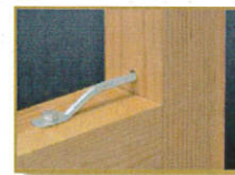
■ PZレスピー羽子板ボルト (PZ-LSB-E2)