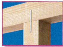
■ PZスリムかすがい (PZ-SLMC-120)