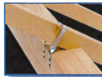
■ たる木クランプ・II