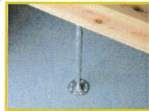
■ ブロウエーブ鋼製束 (PZ-PW)

サイズ▶ 230 270 330 (調整範囲) 170 242 220-330 280-350 370 430 510 320-430 380-460 460-570