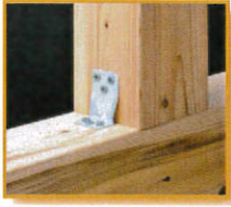
■ PZリブコーナー (PZ-LB)