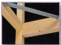
■ プロニック600 (PHB-600ピスタイク)