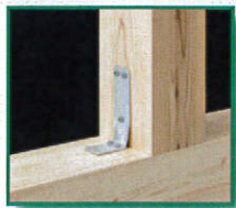
■ PZハイバースリム・II (PZ-HS10-II)

告示1460号第2号 え 対応 耐力▶[中柱] 10.9kN [隅柱] 10.4kN