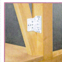
■ PZハイパーガセット・II (PZ-HG-II)

告示1460号第1号 え 対応 壁倍率▶2倍用 床合板▶あり・なし兼用 取付位置▶内付け・外付け兼用