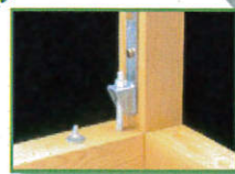
■ PZユニハットアンカーボルト (PZ-UHA)