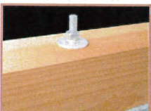
■ PZバネ付丸座金 (PZ-4.5 x 45φ-B)