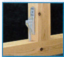
■ PZハイパーホールダウン23 (PZ-HPH-23)

告示1460号第2号 え 対応 耐力▶[中柱] 10.8kN [隅柱] 10.0kN