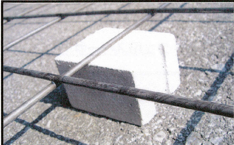
ブロックスペーサー施工例