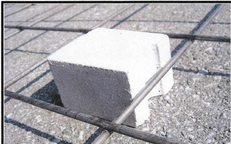
ブロックスペーサー脱落例