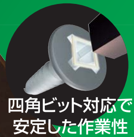
四角ビット対応で 安定した作業性